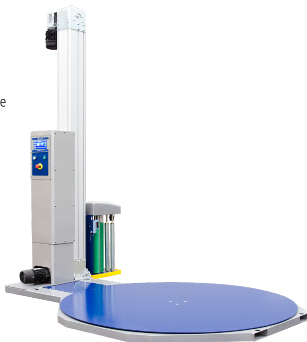
Afmetingen CTT 300

< Klik hier voor een video van de CTT 300 >